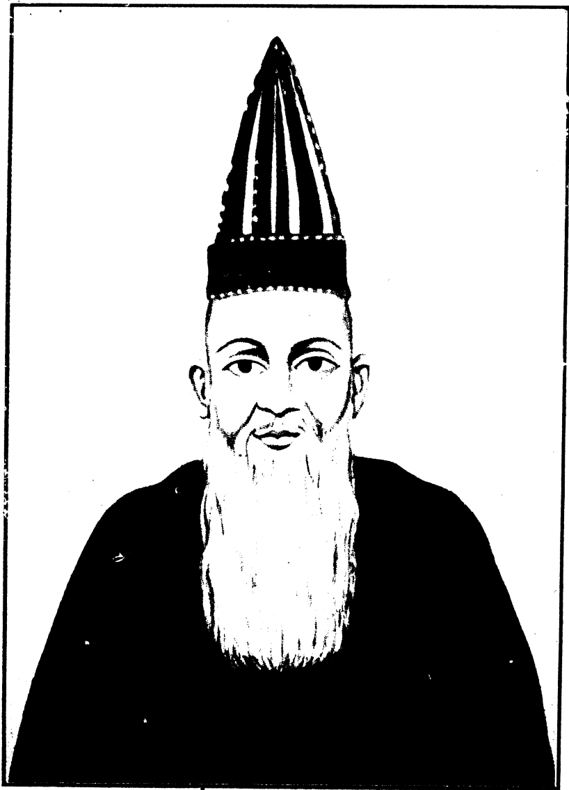
महात्मा कवीरदास ( प्रौढ़ावस्था का चित्र )